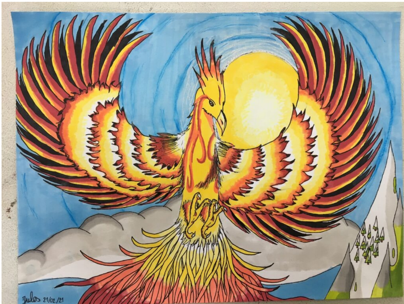
Dessin de Jules Froissard